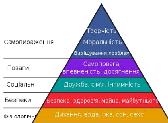
(рис.1 піраміда за А.Маслоу)

А.Маслоу подає свою теорію у вигляді піраміди з чітким розмежуванням потреб та певною ієрархією. Визначальною ознакою цієї теорії є те, що без задоволення базових потреб, що є фундаментальними, людина не зможе просуватися далі (мал.1). Недоліком цієї теорії можна вважати, що вона є досить загальною і у цій інтерпретації не може бути застосована в організації, але в цей час слугує ключем до розуміння усіх основних потреб без яких ефективність працівника ніколи не буде максимальною [2, с.79].